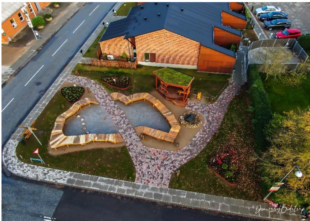
Torvet i Kragelund

Silkeborg Kommune har lavet en udstykning i Kragelund med 12 grunde til parcelhuse plus en storparcel, hvor Silkeborg Boligselskab bygger 10 rækkehuse.